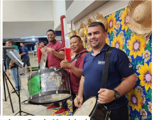
Abertura do Boa Vista Junina - Banda Municipal