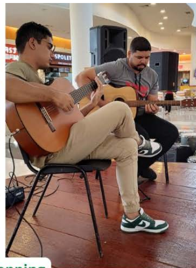
Música na Praça - Pátio Roraima Shopping