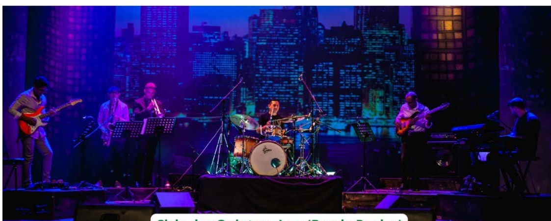
Ciclo das Quintas - Jazz (Banda Realce)