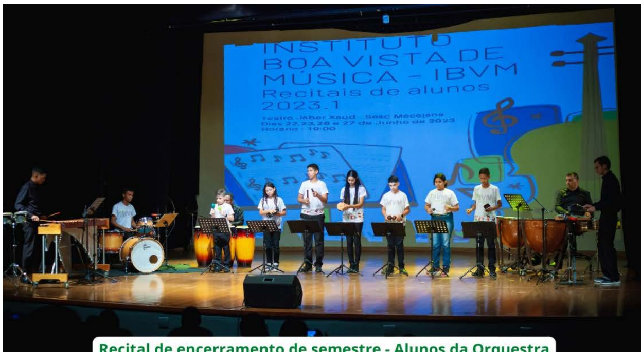
Recital de encerramento de semestre - Alunos da Orquestra