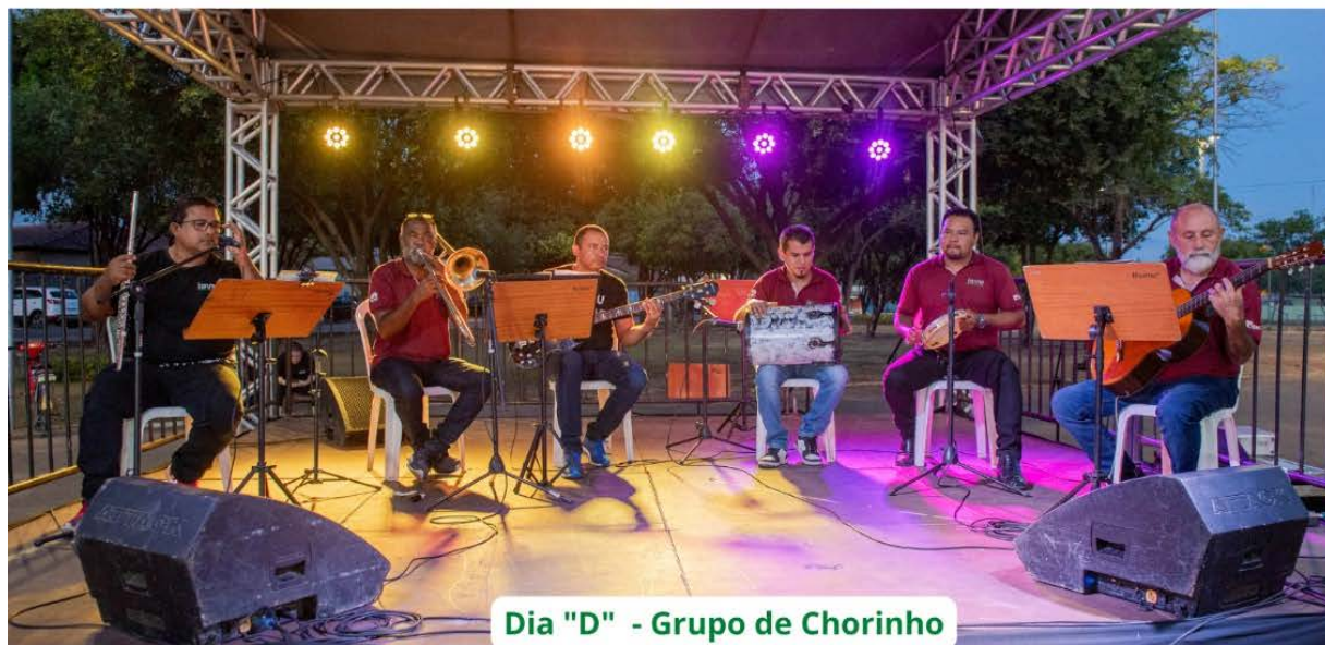
Dia "D" - Grupo de Chorinho